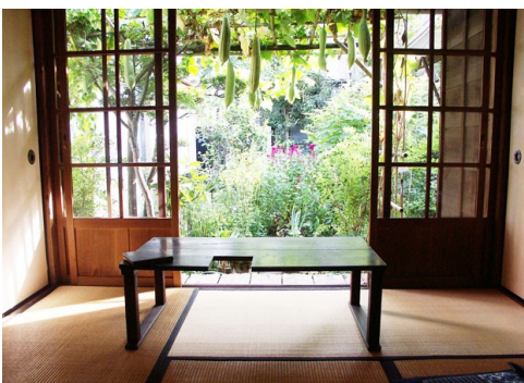
子規庵(病室兼書斎)