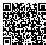
社会教育センターHP