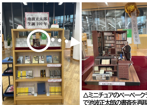
△ミニチュアのパーペークラフトで池波正太郎の書齋を再現

中央図書館では、企画コーナーとして「生誕100年作家特集」を開設。この機会に、ぜひ生誕100年を迎えた作家たちの名著に触れてみてはいかがでしょうか。