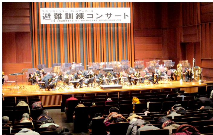
演奏途中でのシェイクアウト訓練の様子▷

～当日のプログラム～ 第10連隊行進曲 (Death or Groly) 鎌倉殿の13人 G線上のアリア ファイヤーマンスピリットマーチ 雷鳴と稲妻 ロマンスの神様 アルデバラン 昭和歌謡コレクション