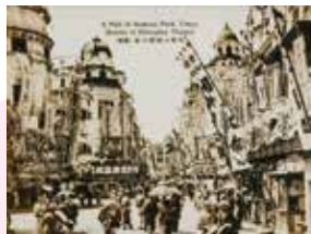
▲1919(大正8)年頃の浅草六区の様子 映画『浮き沈み』田中栄三監督、『相馬大作(楡山騒動)』吉野二郎監督、『佐倉宗五郎』

かつては興行館、映画館や劇場が立ち並んでいた浅草六区。1873(明治6)年に浅草寺境内が「浅草公園」と命名され、1884(明治17)年に1区から7区までに区画整理されたのがきっかけ。明治から戦後までの長い期間、日本の興行の中心で、多くのスターを生み出した。近年、客足が遠のいたといわれていましたが、複合型エンターテインメント施設などが続々建設され、大きくその姿を変えようとしています。