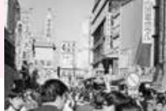
▲1971(昭和46)年頃の様子 映画『新編走番外地 吹雪の大脱走』植木等主演の『日本一のショック男』 ※台東区立中央図書館所蔵 撮影:高相嘉男氏