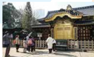
▲修復が完了した東照宮。