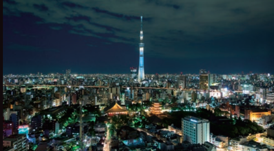
「浅草ビューホテル」27階レストランから浅草方面を望む