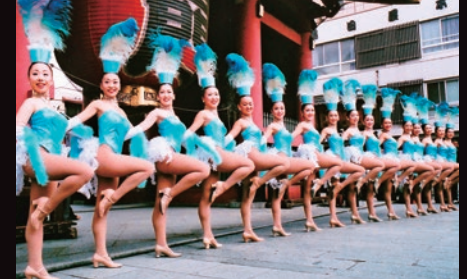
雷門前でラインダンスを披露したSKD-OG「STAS」