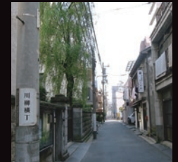
蔵前「龍寶寺」門前の「川柳横丁」