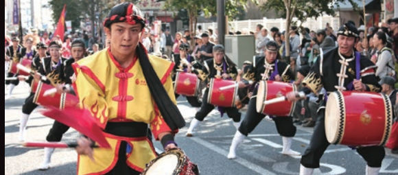
昨年の浅草国際通り「ビートエイサーパレード」

イベント、見どころ 盛りだくさん!! 台東区「台東くん」 TXイメージキャラクター「スピーィ」▲