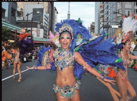
浅草サンバカーニバルパレードコンテスト