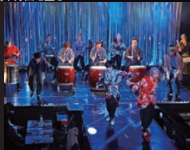
「浅草六区 ゆめまち劇場」の舞台