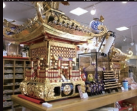
「岡田屋布施」店内にある神輿