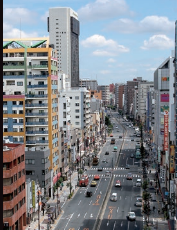
「ホテルサンルート浅草」から「国際通り」を望む