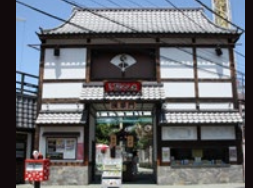
「浅草花やしき」(浅草門)