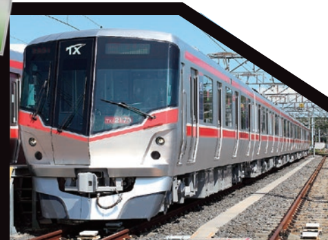
つくばエクスプレス