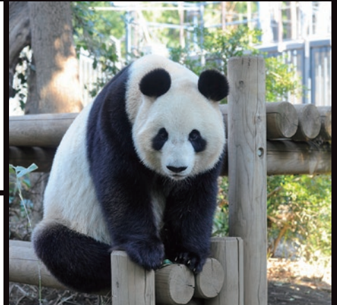
上野動物園のパンダ