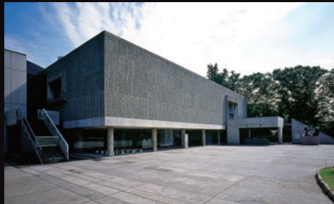
国立西洋美術館を世界遺産に! 国立西洋美術館