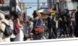
▲谷中公園からも東京スカイツリーが見える。望遠レンズ使用。