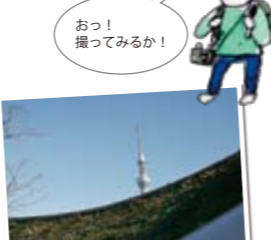
④香炉峰の雪ならぬ東京スカイツリーはGTS「グリーンプラネット」越しに。