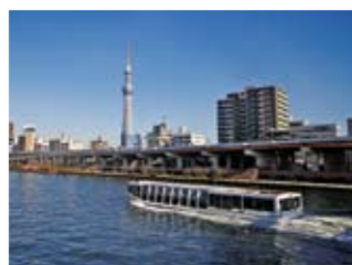
⑥蔵前橋。ひっきりなしに通る船は隅田川のいいアクセント。