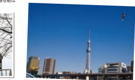
⑤駒形橋手前から。広角側で空を大きくとる。アクセントにカモメを入れると、写真に動きがでます。