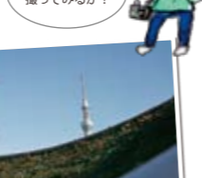
②桜橋でカモメに餌を与えている人がいたので、すかさず撮影。