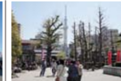
▲案外気がつかないものですが、浅草寺境内からも大きく見えます。