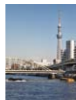
⑥蔵前橋から。望遠レンズを使うと圧縮効果でぐっと寄った画面に。