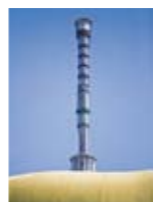
④吾妻橋から。望遠端で寄って撮影してみるとひと味違う写真に。