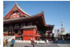
▲東京スカイツリーを遠景に浅草寺を撮る。広角レンズで。