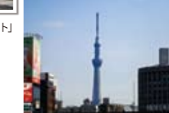
▲合羽橋本通りからコントラスト強めに望遠。