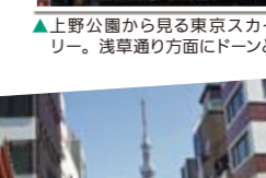
▲上野公園から見る東京スカイツリー。浅草通り方面にドーンと。