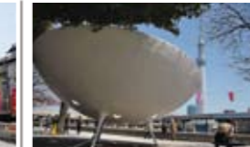
▲左ページのGTS「グリーンプラネット」全景と東京スカイツリー。