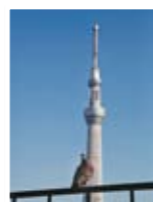
④手すりに止まったハトを主役に。