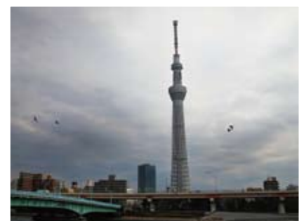
③言問橋付近。雲が出てきたので雲を生かすために、ちょっと暗めに仕上げた。鳥も入ると空間が生まれます。