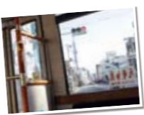
▲走っているバスの車窓から。

ちょっと離れた場所から見る東京スカイツリーもやはり面白い。東京スカイツリーはあちこちから見えるので、いい場所を探してみてもう東京の風景の一部になっているので、東京スカイツリーそのものだけではなく、スナッパ感覚で街の風景と一緒に撮影すると、思わぬ良い作品になるのではないのでしょうか。