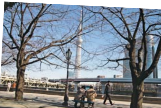
▲隅田公園から望む東京スカイツリー。カップルがのんびりしている穏やかな午後の情景。風景の一部としてとらえるのもひとつの方法。