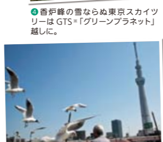
②桜橋でカモメに餌を与えている人がいたので、すかさず撮影。