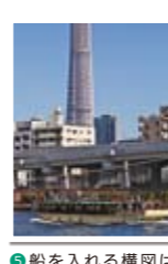
⑤船を入れる構図はこう切り取ってもO。