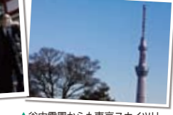
▲谷中公園からも東京スカイツリーが見える。望遠レンズ使用。

POINT 望遠レンズは一本あるとやっぱり便利! でも、標準レンズだけでもアイデア次第。雑誌などに載っている撮り方ではなく、その場その場の雰囲気大切に。またストリートスナッパ撮影では肖像権に注意しつつ、周りの人に気配りながら、楽しんでみてください! 東京スカイツリーに限らず東京の街は常に変わり続けています。東京スカイツリーのように今は目新しい物も、やがて徐々に馴染んでゆき日常の風景になっていきます。また、古くからある風景は、やがて消えていきます。風景写真を撮るといことは、その風景に馴染んでゆき、生活している私たちの記憶をとどめることでもあります。変化を楽しんで!