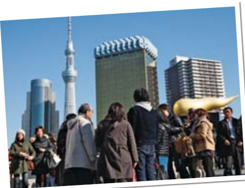
④人で賑わう吾妻橋のたもと。賑わいを表すために人の姿を入れて。画面下方が安定した構図に。