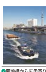
⑦蔵前橋から広角寄りの構図で船を。