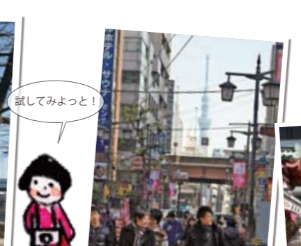
▲アメ横の通りからも見える。突然見えるので驚く人も。