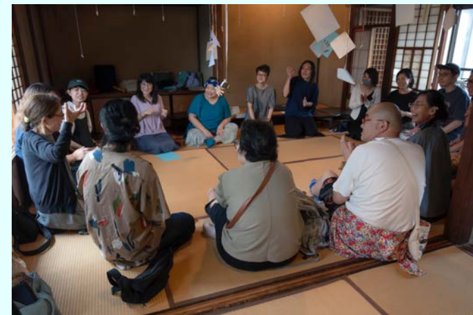
でんちゅうさん ひとめぐり 実施報告書