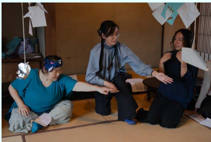
令和6年度台東区芸術文化支援制度対象企画