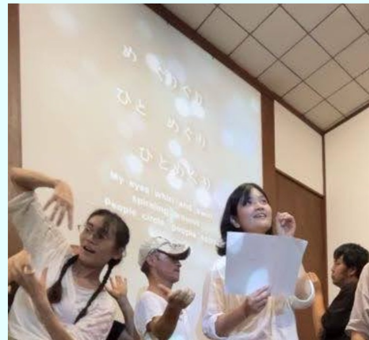
でんちゅうさん ひとめぐり 実施報告書