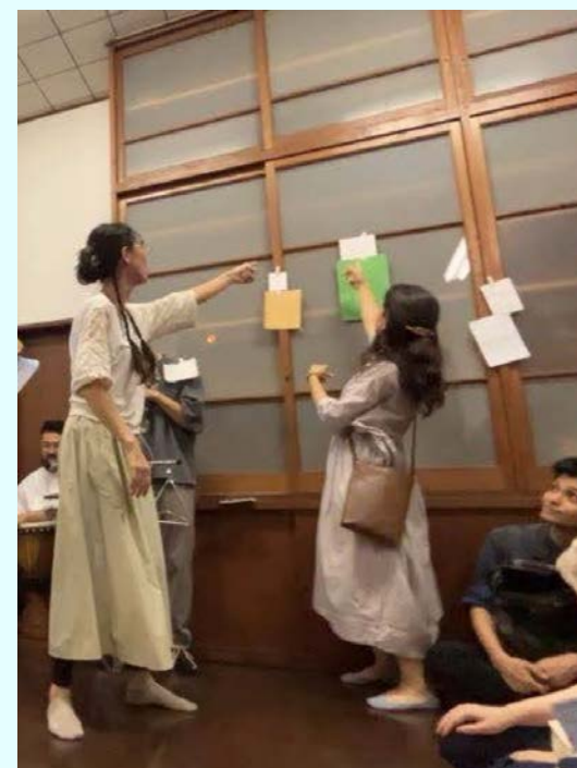
でんちゅうさんひとめぐり 実施報告書