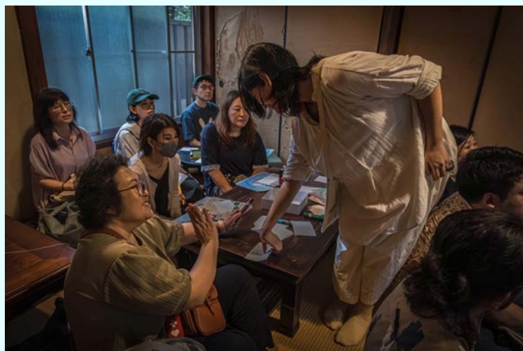
令和6年度台東区芸術文化支援制度対象企画