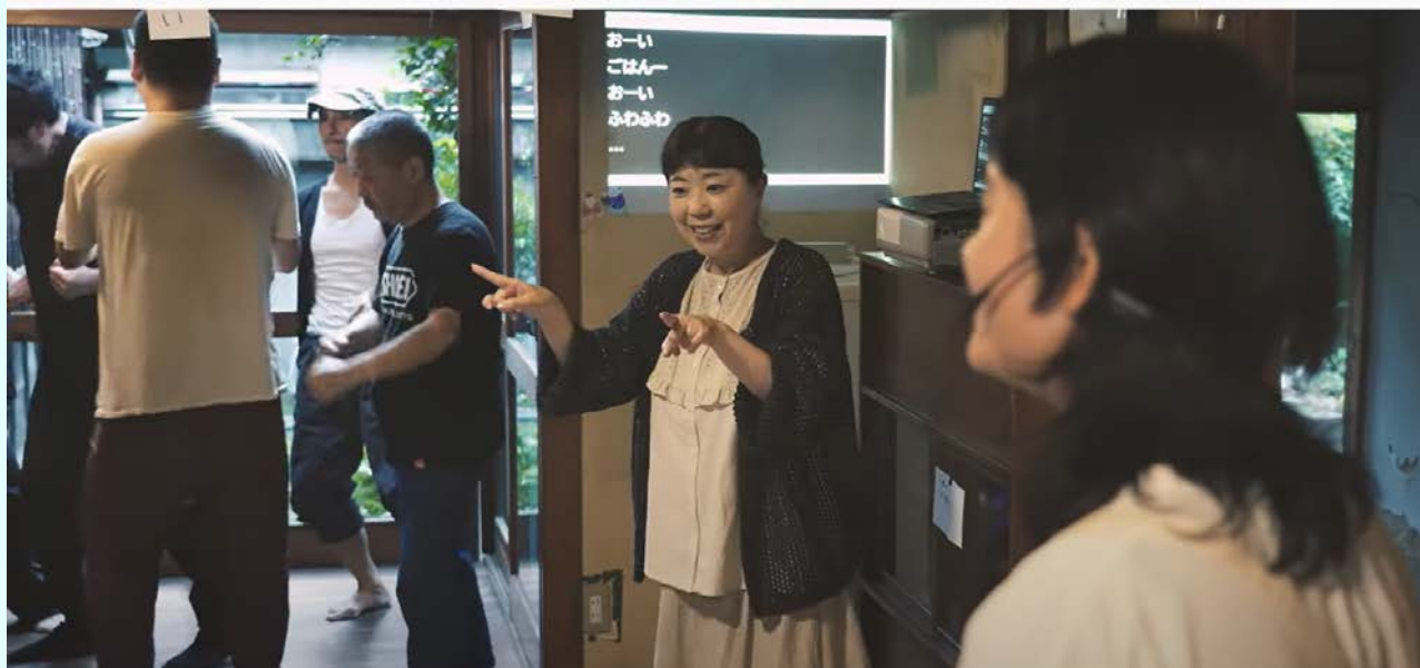
令和6年度台東区芸術文化支援制度対象企画