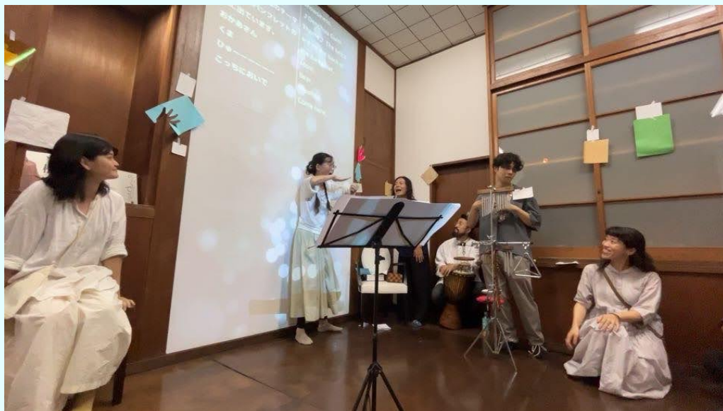
令和6年度台東区芸術文化支援制度対象企画