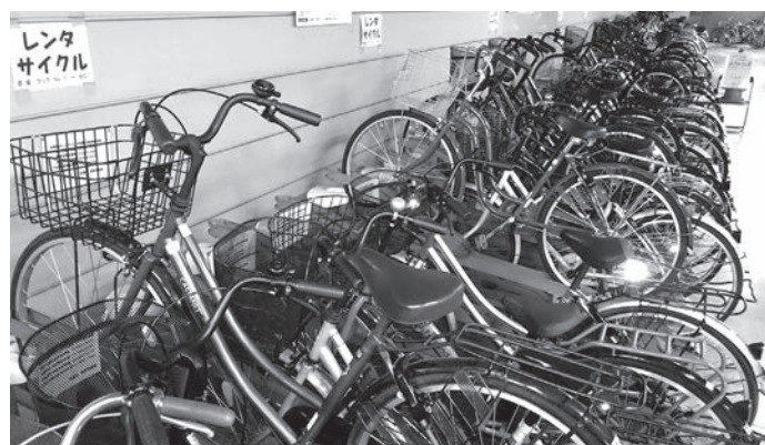
仲御徒町駅自転車駐車場