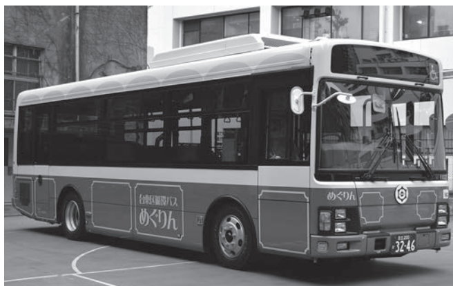
ぐるーりめぐりん (平成28年1月31日運行開始)

このため、観光客の移動手段としても活用されているコミュニティバス「めぐりん」の新路線の開業、車内でのWi-Fiアクセスポイント設置や、自転車走行空間の整備など、交通の利便性と回遊性向上に積極的に取り組んでいく。また、今後も観光客のさらなる増加が想定されるため、区民生活に配慮しながら、観光バスの駐車対策を進めていく。