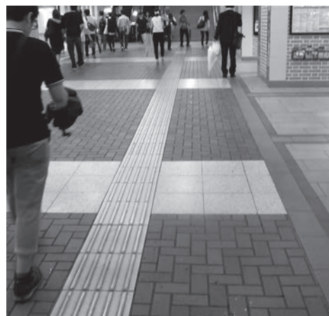
JR上野駅 視覚障害者誘導用ブロック

鉄道駅や道路、ホテル等のバリアフリー化や、さわやかトイレの整備などを進めることにより、区民や観光客の利便性や安全性を高め、年齢や障害の有無などにかかわらず、すべての人が安心して快適に観光できる環境の実現を目指す。