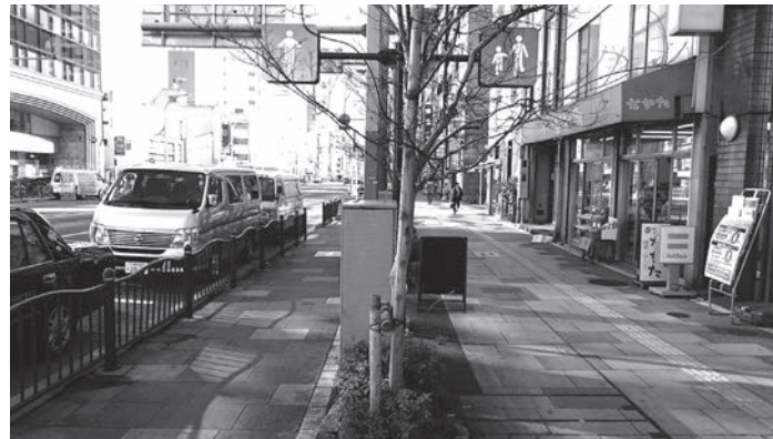
浅草通りの自転車走行空間 (植樹帯で歩道を分離)