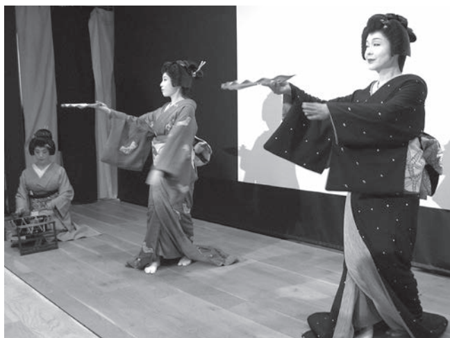
お座敷おどり(浅草文化観光センター)

観光情報の発信拠点である浅草文化観光センターの機能強化や、まちぐるみ観光案内所により、観光客の利便性と区内の回遊性を高める。また、東京都の「国内外旅行者のためのわかりやすい案内サイン標準化指針」を踏まえ、インフォメーションボードの外国語表記等の見直しや、道路主要地点名標識の英語表記の改善などに取り組み、外国人観光客の利便性の向上を図る。