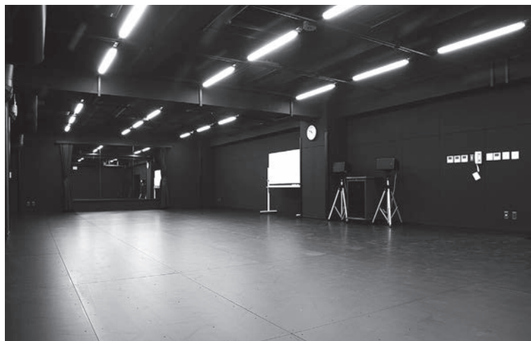
たなか舞台芸術スタジオ