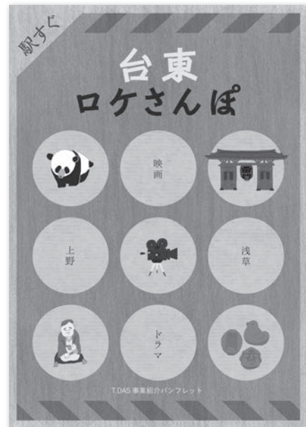
ロケ地めぐりマップ