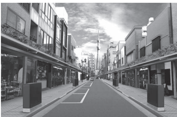
無電柱化後のイメージ(かっぱ橋本通り)