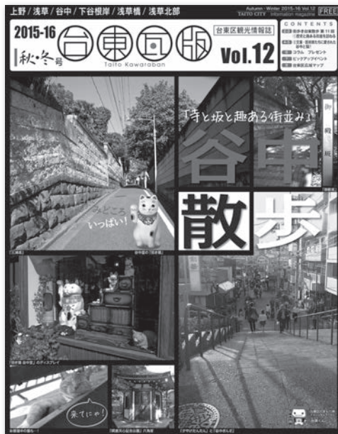
観光情報誌「台東瓦版」