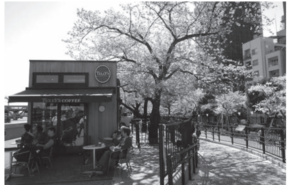
隅田公園オープンカフェ