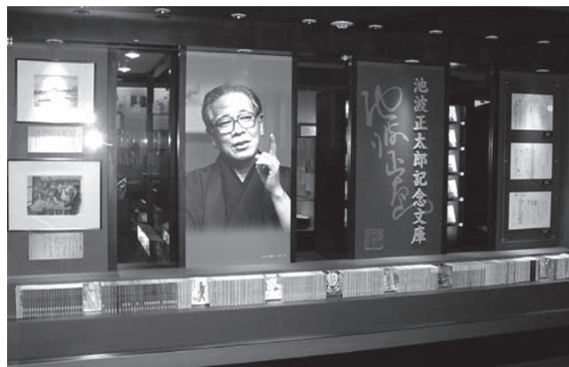
池波正太郎記念文庫