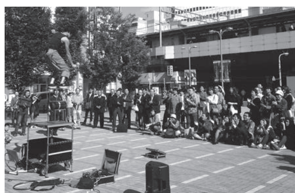
御徒町南口駅前広場(おかちまちバンダ広場)