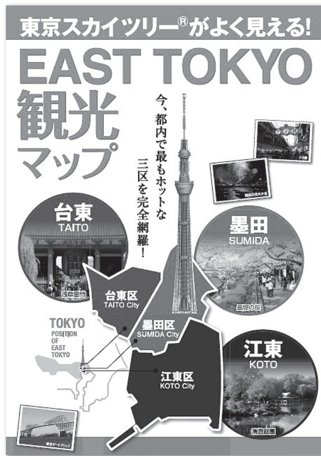
EAST TOKYO 観光マップ