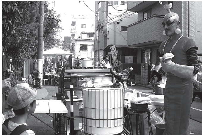
芸術文化支援制度 採択企画