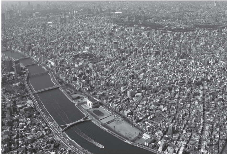
空から見た台東区