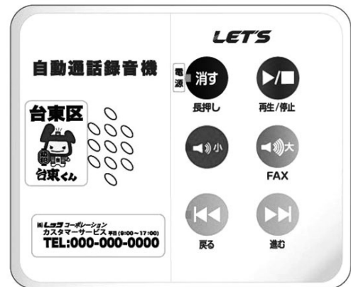
〔自動通話録音機〕イメージ