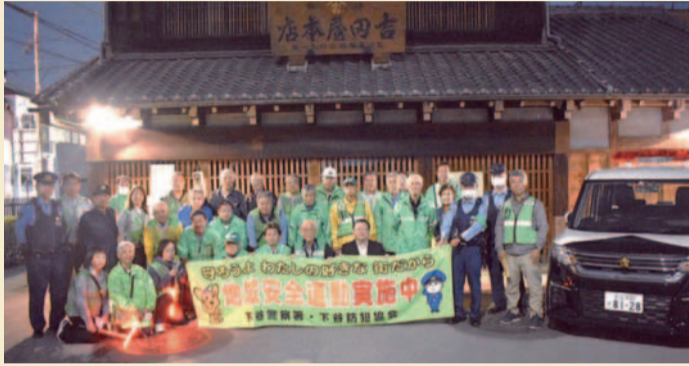
谷中地区町会合同パトロール