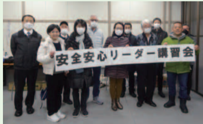
浅草寿町三丁目東町会