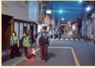
パトロールの様子

合同パトロール隊は、歴史文化にあふれる谷中地区において、人通りの少なくなる夜間に犯罪抑止と街の環境浄化を目的とした合同パトロールを精力的に実施し、谷中地区の安全安心なまちづくりに貢献しています。