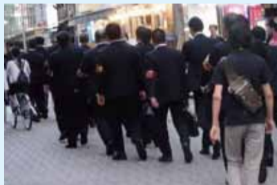
暴力団による違法行為排除