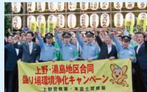
環境浄化キャンペーン

国内外から多くの観光客が訪れる上野地区の盛り場環境を、「安全で安心して楽しむことができる」「健全で魅力あるもの」にするため台東区も協力して推進しています。