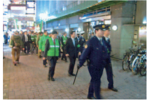
上野商店街盛り場地区パトロール隊

上野商店街連合会を中心に台東区、上野警察署と合同で月1回午後8時から9時までの間、上野駅周辺や上野2丁目周辺の盛り場地区の防犯パトロールを実施し、悪質な客引きやキャッチセールス防止活動、不正看板等の撤去等の環境浄化活動を実施しています。