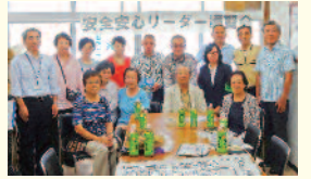
御徒町二丁目町会