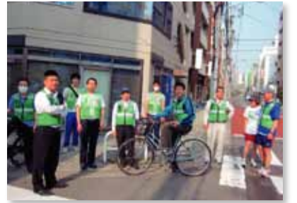
青年部の早朝パトロール