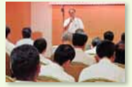
上野警備業の皆様