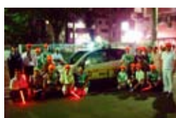
上野地区合同パトロール