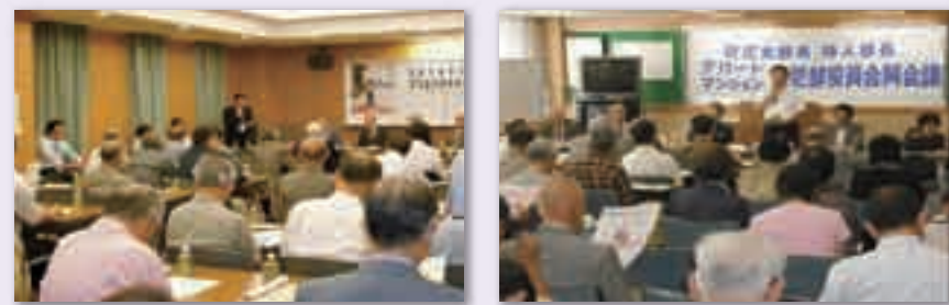
(東上野地区センターの様子) (蔵前警察署講堂の様子)